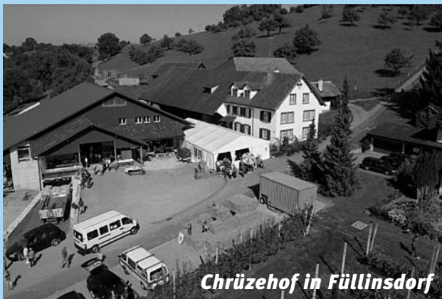
Chrüzehof in Füllinsdorf

Auf dem Chrüzehof in Füllinsdorf Samstag, 22. September 2012 ab 12.00 Uhr - 02.00 Uhr