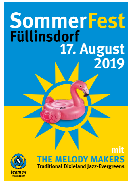
Plakat Sommerfest 2019.